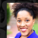
登壇者 キナ・ジャクソン Black Lives Matter Kansai